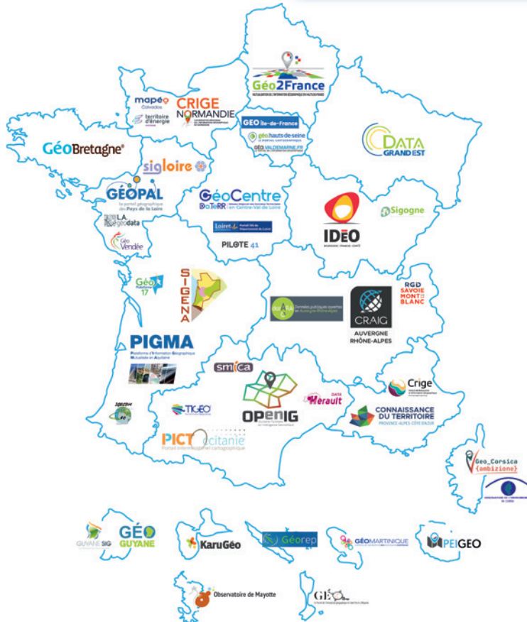
Figure 1. Aperçu des plateformes de données géographiques à vocation régionale ou départementale (sur la base de l'enquête réalisée en 2022).

D'un côté, l'impact du numérique sur l'empreinte carbone nationale augmente de manière exponentielle. D'un autre, la donnée est devenue un outil de gouvernance qui est utilisé pour aider à la décision sur des sujets stratégiques et garantir la transparence des décisions. Dans ce nouveau cadre en pleine transition, les plateformes territoriales doivent redéfinir leur vision pour modifier le positionnement purement géomatique vers une gestion de la donnée au sens large. Ces stratégies nécessitent l'adhésion et le soutien du politique local et national, ainsi que le dialogue avec l'écosystème de la donnée, la société civile et les usagers.