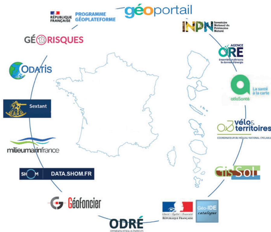
Figure 2. Aperçu des plateformes de données géographiques à vocation nationale.

L'enquête a également permis de mettre en avant des points d'attention suite aux échanges avec les plateformes. L'un de ceux-ci est lié à l'exploitation des données : les plateformes recommandent la standardisation des données et y travaillent activement au sein des groupes de travail via l'Afigéo. Un second est lié à la fragilité économique sur le long terme des existants et les plateformes militent pour un engagement des partenaires locaux et nationaux sur la durée afin de sécuriser la donnée et sa mise à disposition en cohérence avec les territoires. Le rapport fait état de grands axes de perspectives ou d'enjeux à venir :