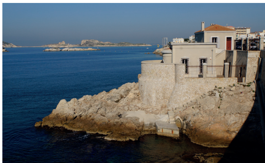
Figure 1. La qualité architecturale des bâtiments du marégraphe de Marseille.

Elle instaure, promeut et entretient une relation de partenariat originale et féconde avec l’Institut national de l’information géographique et forestière, gestionnaire du marégraphe de Marseille. Comme le suggère le chapeau de cet article, nous sommes là devant une mise à jour, un carnet de pages blanches