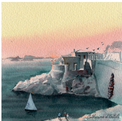
Figure 4. "Soirée au marégraphe", à l'heure où s'allongent dans l'air rose les derniers rayons du soleil – aquarelle de Catherine d'Ortoli, architecte du patrimoine.

Les grands projets de l'Association des amis du marégraphe de Marseille sont : - continuer, sous une forme à définir avec le gestionnaire du site, à ouvrir le marégraphe de Marseille au public (10 000 visiteurs déjà reçus par l'IGN entre 2013 et 2019 (figure 3) ; 10 000 personnes sur liste d'attente) ; - être présents sur Internet (site dédié à l'AAMM) et sur les réseaux sociaux ; - répondre aux sollicitations de la Presse et les susciter (utiliser l'atout patrimonial du marégraphe de Marseille pour expliquer l'intérêt actuel de la marégraphie et de la géodésie) ;