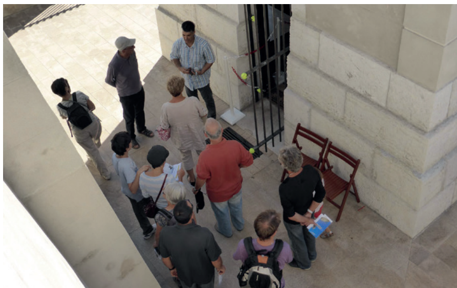
Figure 3. Des visiteurs heureux au marégraphe de Marseille.

qu'il s'agit de remplir de manière volontaire, innovante et positive.